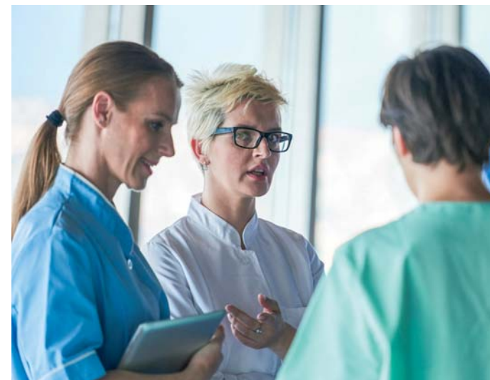
anerkannte Weiterbildung gemäß §§ 34 ff. SächsGfbWBVO